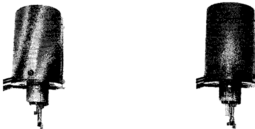
Рисунок 3 - Датчик застывания моторных масел

4.3.5.4 Пробирка с датчиком застывания, находящимся в исходном состоянии, устанавливается в криостат прибора. Поднятый вверх груз перекрывает световой поток между светодиодами, расположенными в корпусе датчика застывания. Опускание груза на поверхность пробы происходит по команде от процессора прибора при достижении заданной температуры охлаждения. Если проба застыла, то световой поток перекрыт. По мере нагревания пробы начинается подвижка груза, световой поток открывается. Сигнал от приемного светодиода поступает на входной усилитель электронного блока управления. Температура, при которой сигнал с датчика застывания максимален, считается температурой застывания исследуемого образца.